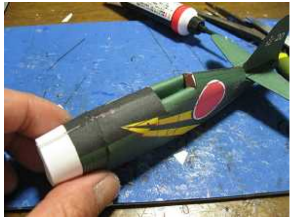
2.組み上がった胴体。