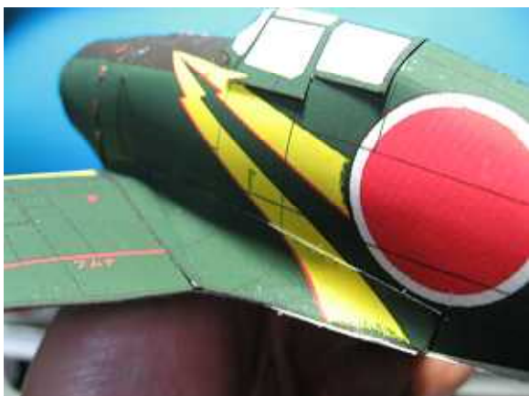
8.フィレットの形状。