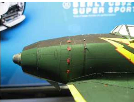
7.カウリングの取り付け位置。