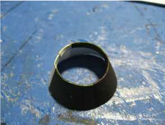
5.機首は中に折り込んでください。