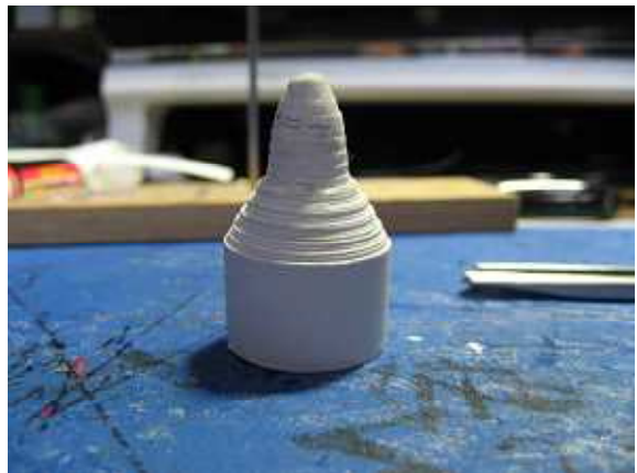
4.錘の形状。ちなみに15mm幅の紙で作っています。スピナー部は茶色で塗装してください